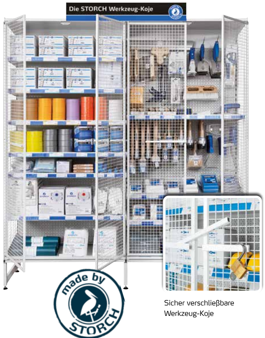
Sicher verschließbare Werkzeug-Koje