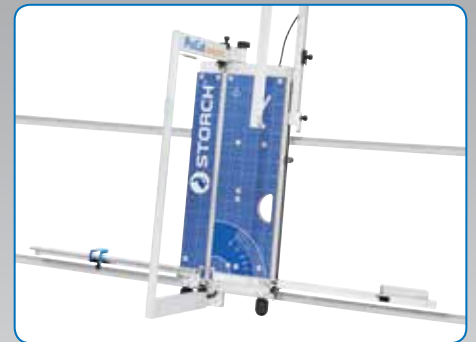
Kompakte Abmessungen ideal für Gerüste