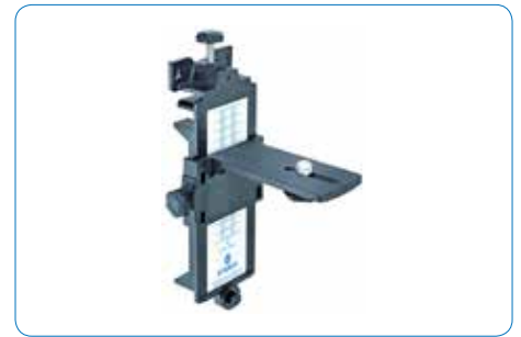
Wandhalterung mit 5/8" Stativgewinde