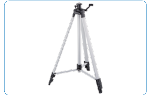
Stativ bis 1,8 m Höhe mit 5/8" Stativgewinde