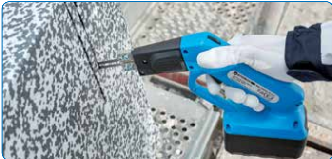
Komfortabel und schnell den Arbeitsplatz einrichten, ohne Stromkabel zu verlegen