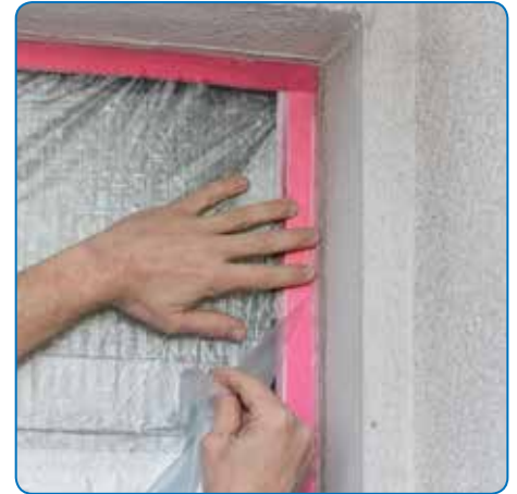
Schnelles und genaues Fixieren von CQ und Folien