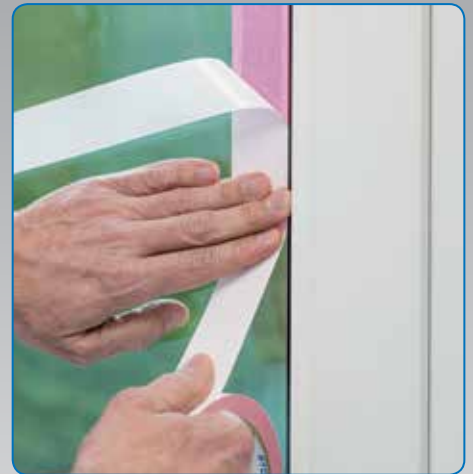
Problemloses Abkleben weichmacherempfindlicher Untergründe