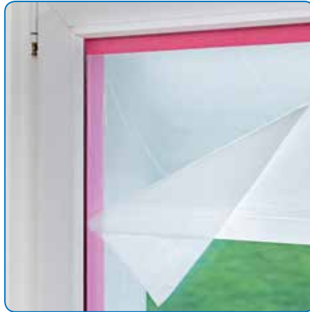
UV-beständiger Kleber für direkte Sonnenbestrahlung