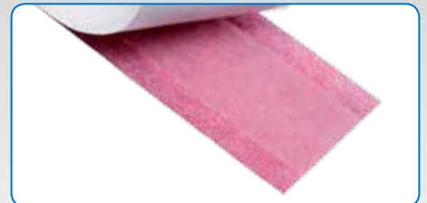
Beidseitig klebstofffreier Randstreifen