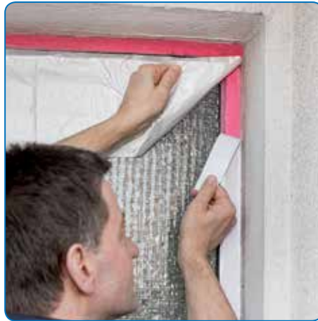
Problemloser Einsatz auf weichmacherempfindlichen Untergründen